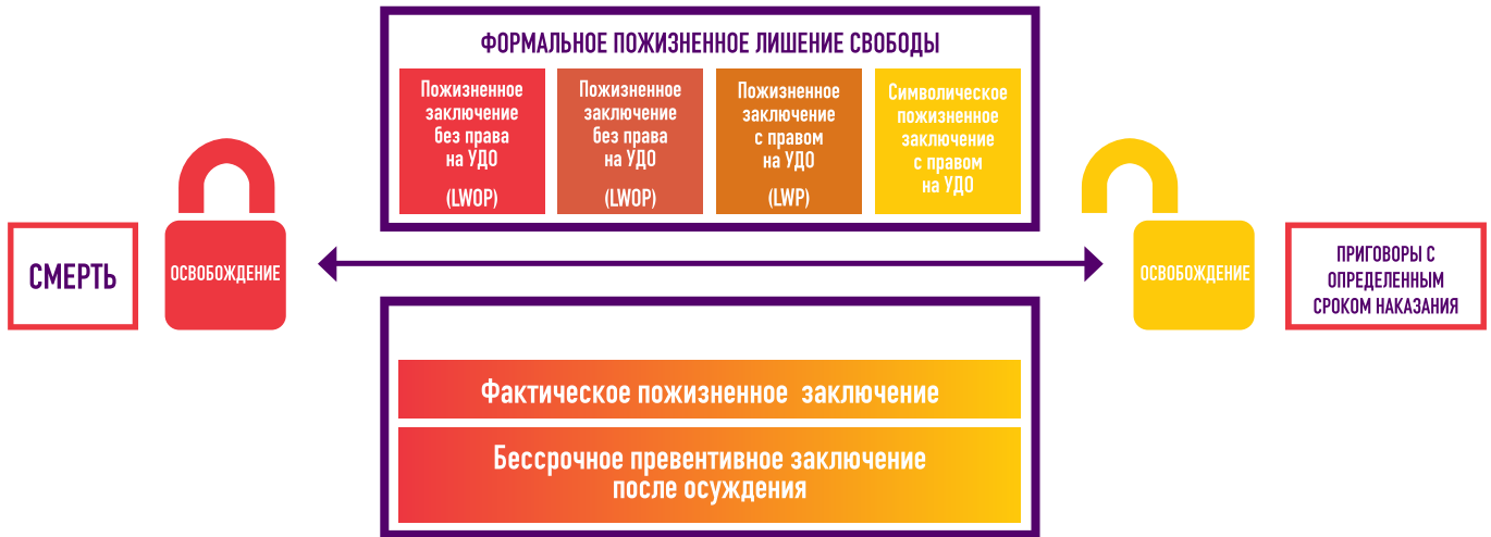
Рисунок 1: Виды пожизненного заключения

Предлагаемое определение термина предусматривает охват всех видов пожизненного заключения. Пожизненное заключение – вид уголовного наказания, дающий право государству лишать определенное лицо свободы на срок от момента вступления приговора суда в законную силу и до биологической смерти заключённого.