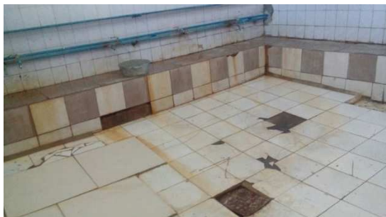
Фотография 1. Моечная в бане ИУ ОВ 156/18 ДУИС ВКО

16. Учитывая фактический рост численности ВИЧ-инфицированных осужденных в местах лишения свободы ДУИС ВКО следует усилить профилактическую направленность в работе по предупреждению распространения ВИЧ СПИД среди контингента осужденных в ИУ.