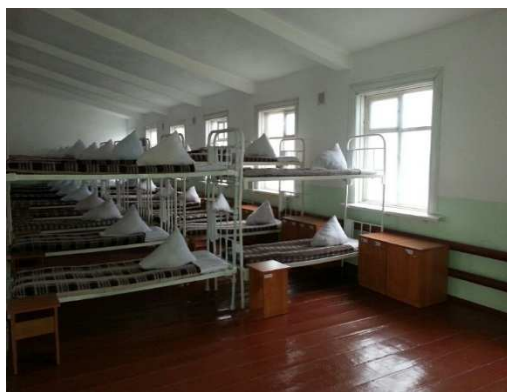
Фотография 4. Спальные места в отряде ОВ 156/2 ДУИС ВКО