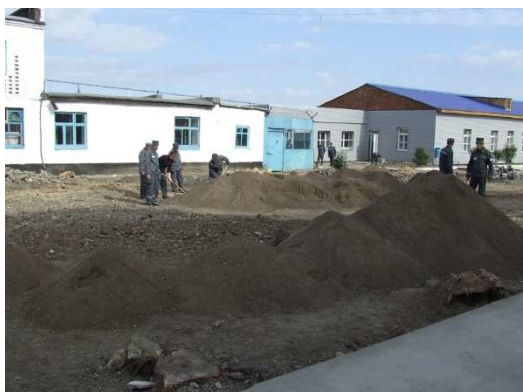
Фотография №3. Идет строительство спортивной площадки ОВ 156/6