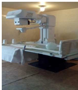
Фото № 2. Рентгеновский аппарат в стоматологическом кабинете медсанчасти ИУ ОВ 156/6