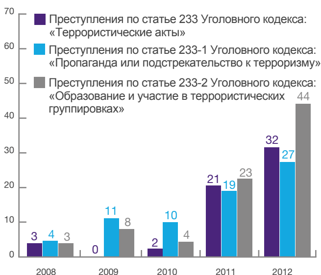
Схема 2: Приговоры за преступления, связанные с терроризмом, вынесенные в 2008-2012 годах

См. Приложение 1 для получения более подробной информации по преступлениям, подпадающим под указанные ниже статьи.